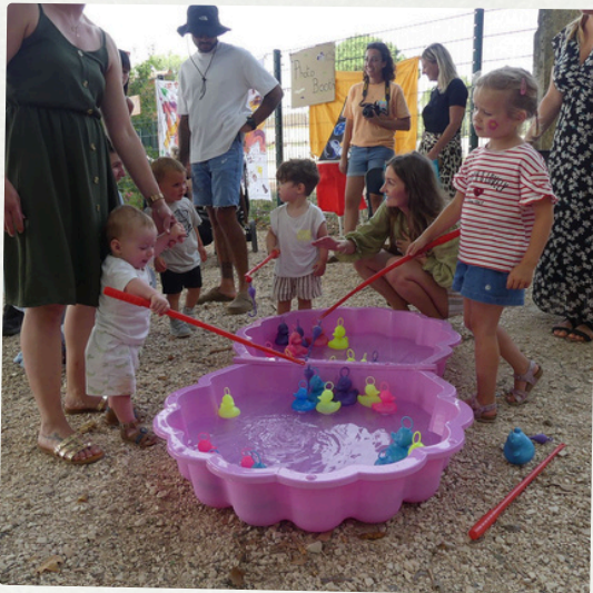
Kermesse de la crèche 28 juin 2024