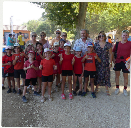
ODElympiques 25 juillet 2024