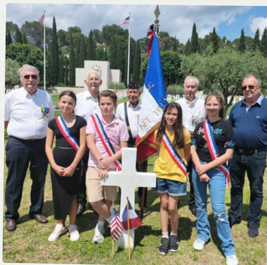
CMJ : visite du cimetière américain 7 juin 2024