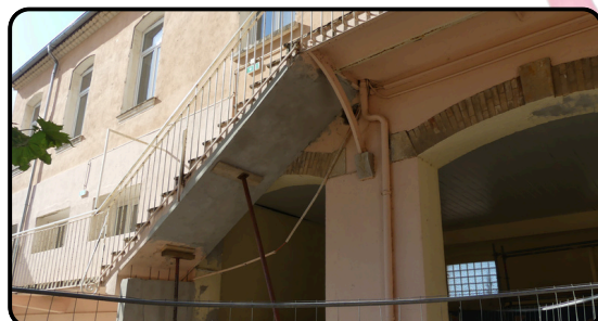
Sous-pente de l'escalier