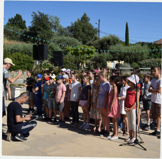
Fête de la musique 21 juin 2024