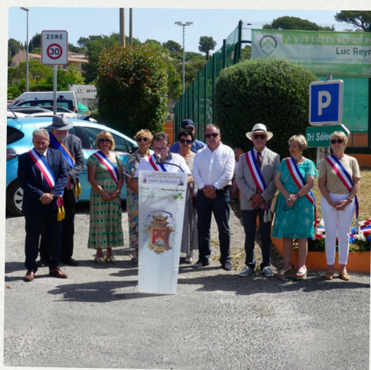
Appel du Général de Gaulle 18 juin 2024