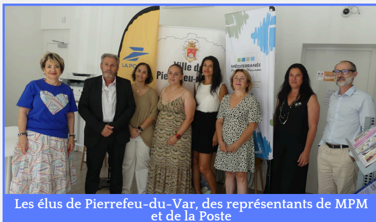
Les élus de Pierrefeu-du-Var, des représentants de MPM et de la Poste

Ce projet, conjointement réalisé avec la communauté de communes MPM, ravit déjà les Pierrefeucaïns.