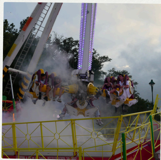
Fête foraine 14 au 16 juin 2024