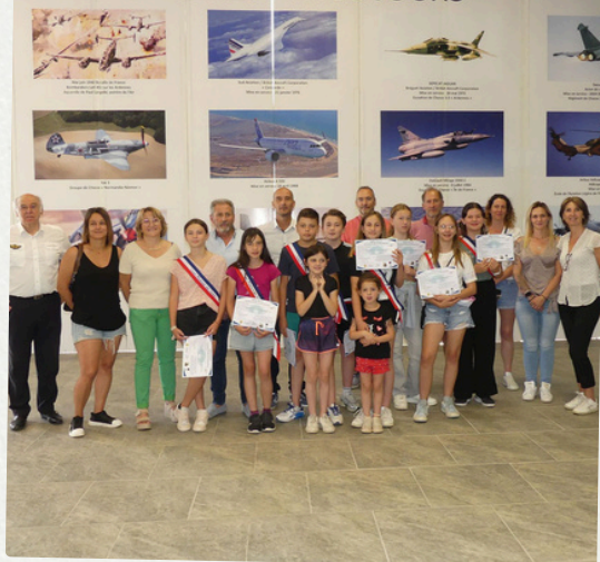
Baptêmes de l'air pour le CMJ 29 mai 2024