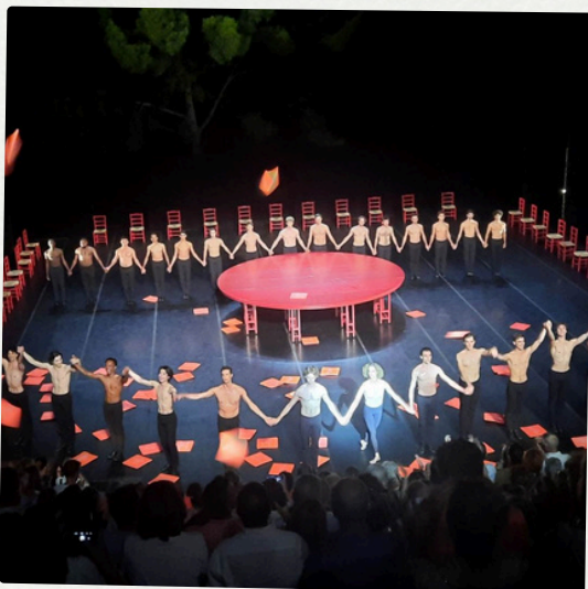
Châteauvallon : Béjart Ballet Lausanne 19 juin 2024