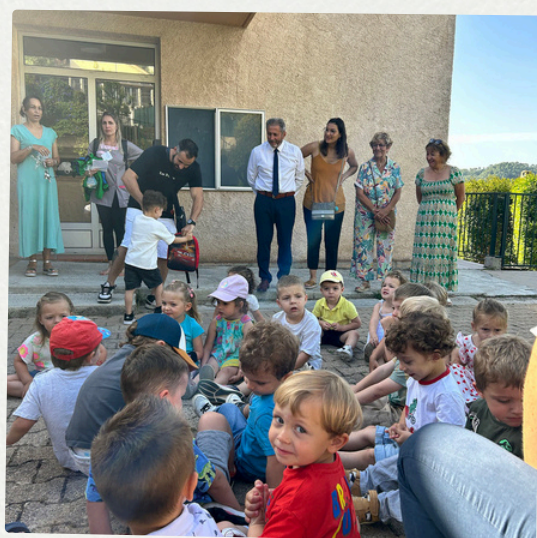
Maternelle : visite de la crèche 18 juin 2024