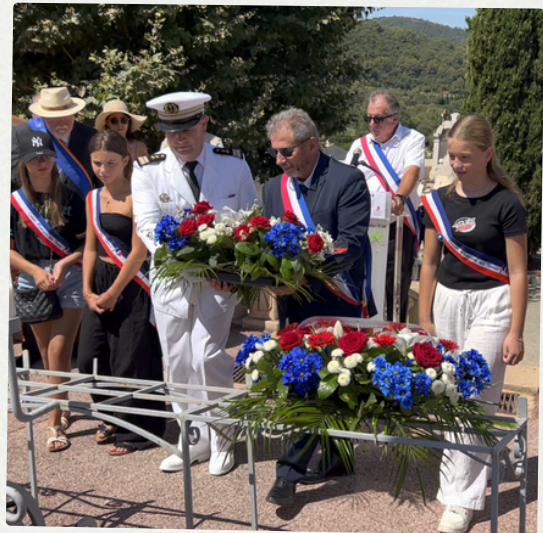
Cérémonie de la Fête Nationale 14 juillet 2024