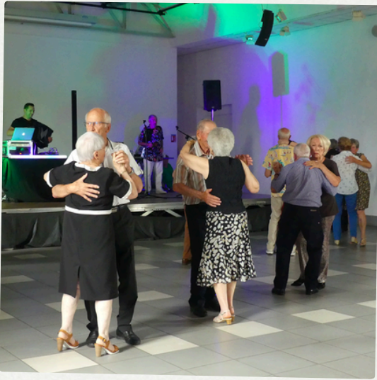
Thé dansant 20 juin 2024