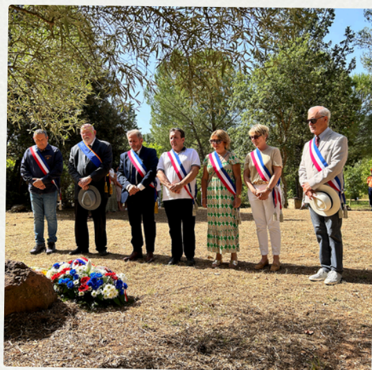
Hommages à l'Arboretum 18 juin 2024