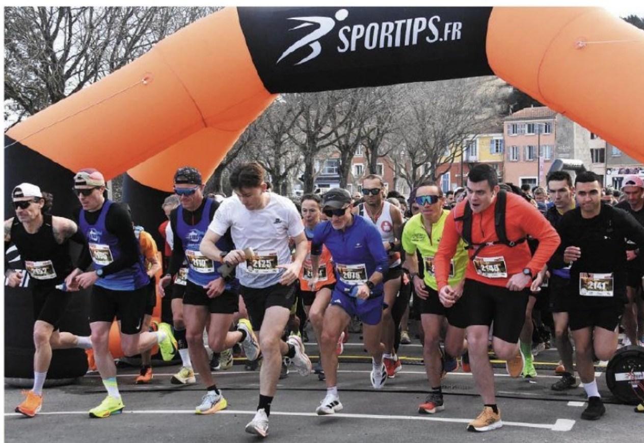
Le premier semi-marathon de Pierrefeu a connu un franc succès.

JOURNÉE SUIVANTE (J17) - Dimanche 16 mars : St-Étienne - Hyères/Pierref.