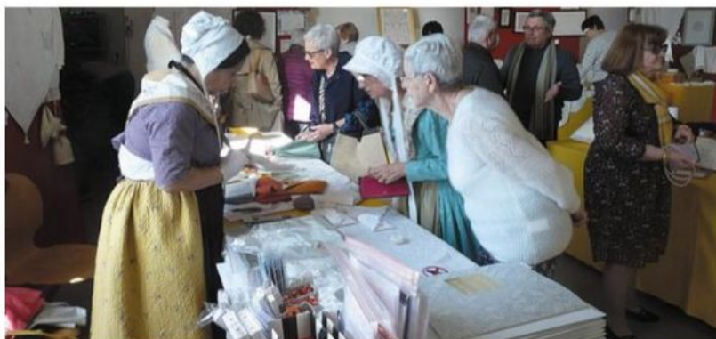
Qualifié d'ouvrage divin par Frédéric Mistral, le boutis sera en exposition tout le week-end.