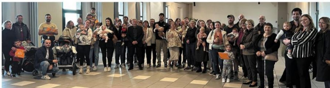
Une trentaine de familles pierrefeucaines ont reçu le livret de naissance de leur enfant.

MARDI SOIR, À L'INVITATION de la municipalité de Pierrefeu-du-Var, les parents des enfants nés en 2024 se sont rendus à la salle André-Mal-