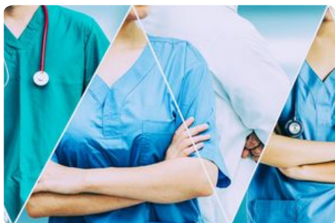
Médecins et numéros utiles