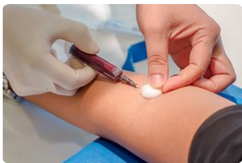
Collecte de sang